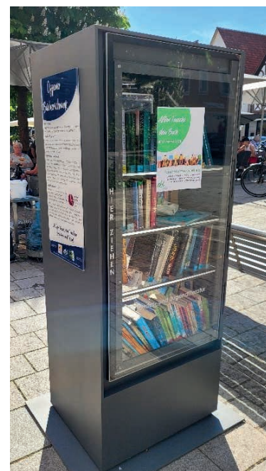
Bücherschrank in Ebermannstadt, Kulturkreis Ebermannstadt e.V.

Alle Informationen und Unterlagen zum Download finden Sie unter www.kulturerlebnis-fraenkische-schweiz.de/Aktuelles .