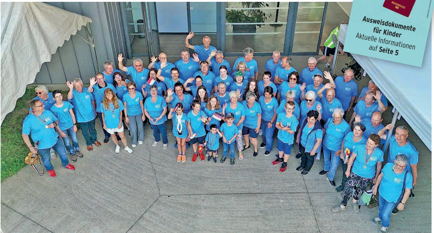
Keine Mannschaft, sondern eine bunt gemischte Reisegruppe: Die Igensdorfer Besucher in einheitlichen Team-Shirts.