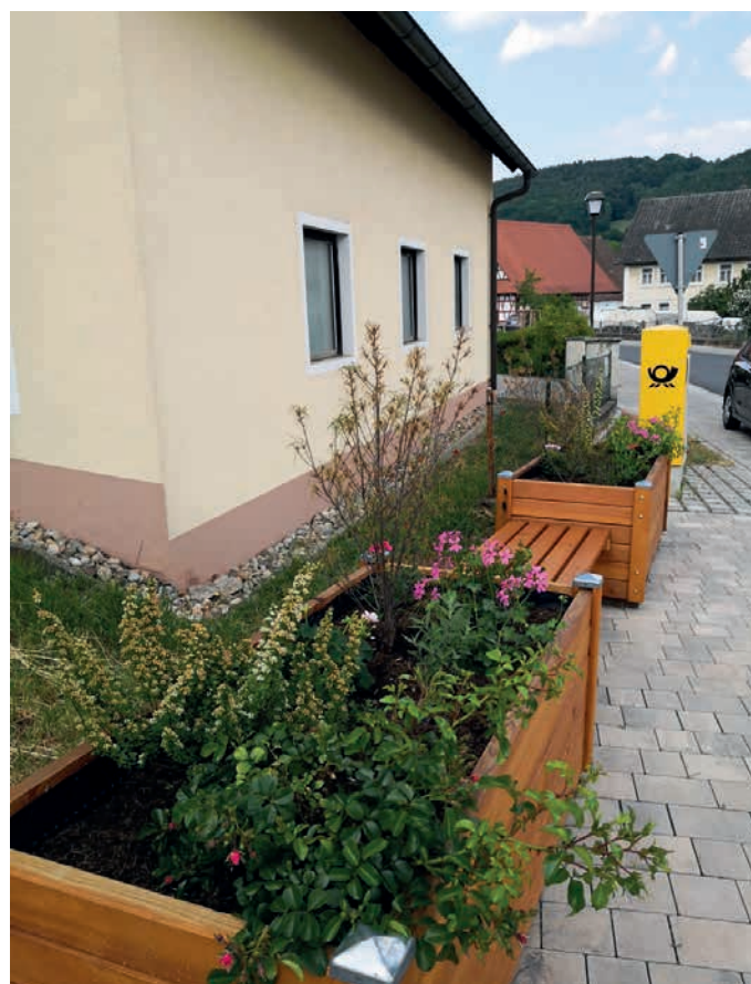
Dorfmitte Weilersbach verschönert mit Bank und Hochbeet, Gartenfreunde Weilersbach.