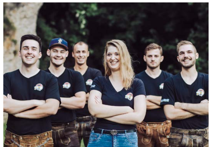
Die sechs „Haumdaucher“ aus Pegnitz machen am Samstagabend Stimmung, bis das Zelt abhebt...