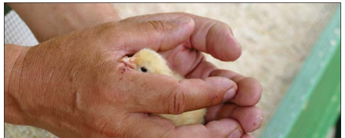
Die Küken-Brüterei des Geflügelhofs Schubert war ein großer Anziehungspunkt für Kinder. Auch viele Erwachsene bestaunten mit Freude, wie die Küken schlüpfen.

nun wieder trockenem Wetter hielt sich auch über das Marktfest hinaus, so dass sich die Feststellung „Regen beim Igensdorfer Marktfest? Das gab es ja noch nie!“ glücklicherweise nur auf einen kurzen Ausschnitt der Veranstaltung bezog und trotz des morgendlichen Schauers auch am Sonntag weitgehend trocken gefeiert werden konnte. Die Gemeindeverwaltung möchte sich an dieser Stelle nochmals für das Engagement aller beteiligten Vereine, Helfer und Unterstützer rund um die Veranstaltung bedanken, bei den Marktleuten für ihre Teilnahme sowie bei allen Gästen für ihren Besuch. Wir hoffen, es hat Ihnen gefallen und freuen uns bereits jetzt auf ein Wiedersehen beim Marktfest 2025, welches traditionell vom Musik- und Trachtenverein ausgerichtet wird.