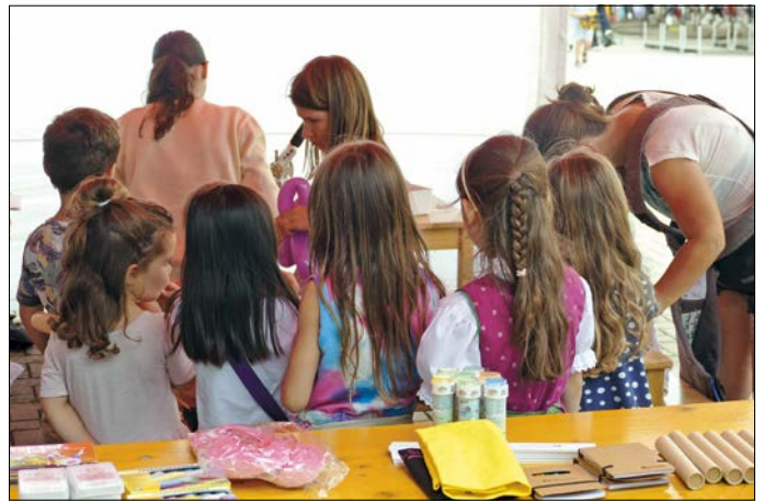
Während die Erwachsenen bummelten, ging es in der Kinderecke lebendig zu.

Marktfest und Festbühne, die sogleich die POUND-Gruppe des FC Stöckach mit einem fulminanten Auftritt rockte. Anschließend übernahm das Duo „Keep it simple“ mit chilligen Klängen und Gesang, zu denen sich zahlreiche Gäste auf den Bierbänken rund um die Bühne niederließen, um die laue Sommernacht gemütlich ausklingen zu lassen. Bedauerlicherweise verhiess die Wetterprognose für den Sonntagmorgen nichts allzu Gutes und so kam es, dass der Festgottesdienst im Freien dem starken Regen geschuldet kurzerhand in die St. Georg-Kirche verlegt wurde, wo Pfarrer Leonhard Hewelt seine Schäfchen, Fest- und Ehrengäste sicher behütet im Trockenen wusste, während der Kirchenzug vorab sprichwörtlich ins Wasser fiel. Da das Wetter anschließend aufklarte, zog die Festgesellschaft stattdessen im Anschluss an den Gottesdienst auf dem Festgelände ein und beging dort, notdürftig vor den letzten Regentropfen geschützt, den Festakt, während parallel dazu die Kinderecke mit allerlei Bastelangeboten und Geschicklichkeitsspielen und einem Glücksrad eröffnete. Hier wurden auch Buttons gestaltet, Luftballonfiguren auf Wunsch gefertigt und am Nachmittag Ohrwurm-Hotels, angeleitet durch den NaBu gebastelt. Rund um den Marktbummel luden die Igensdorfer Vereine und Daniel Zipko Catering zu Speis und Trank bei Gesang und Blasmusik. Das allen Befürchtungen zum Trotz