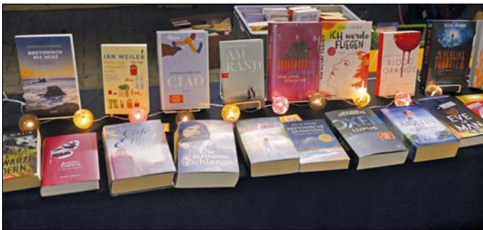
Auch die Marktbücherei beteiligte sich mit einem Stand Second-Hand-Bücher am Nachtflohmarkt