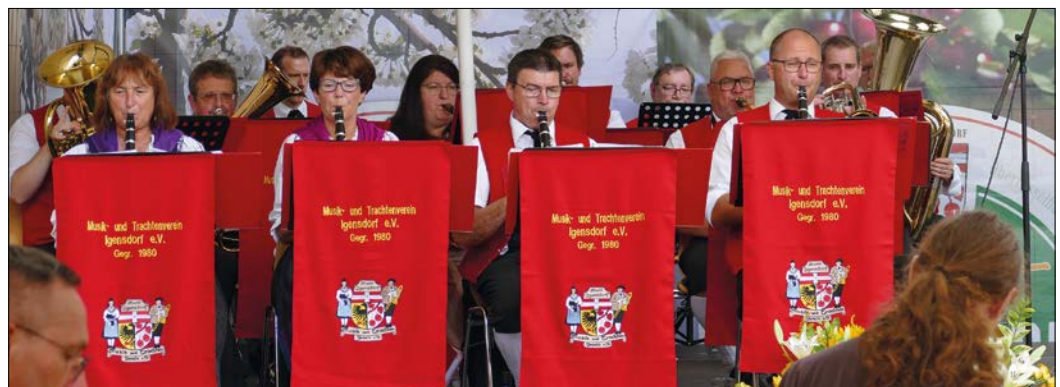
Am Nachmittag sorgte der Musik- und Trachtenverein mit einem bunten Potpourri der Blasmusik für Stimmung und fränkische Gemütlichkeit.