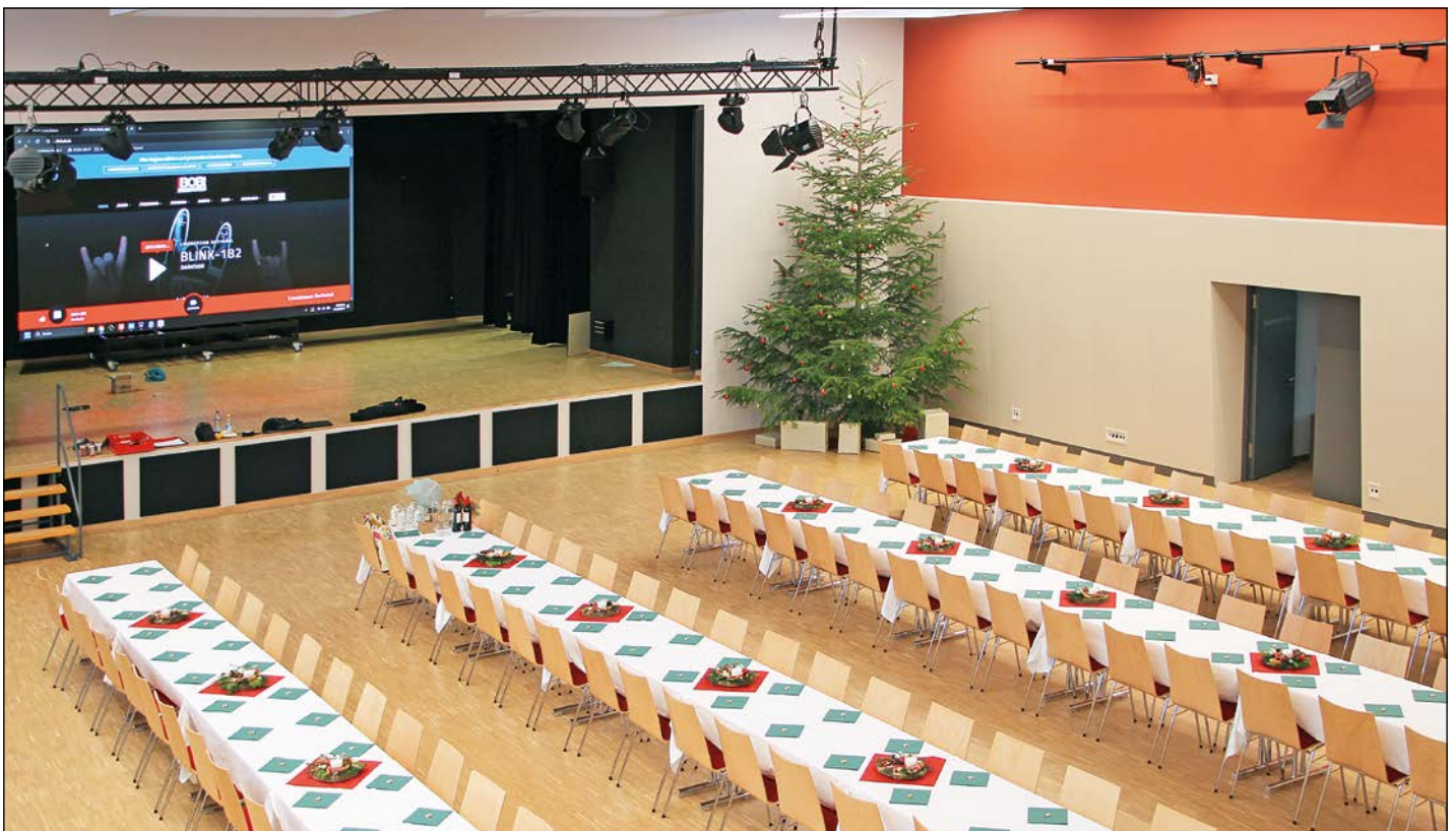
Die sanierte Lindelberg Kulturhalle kurz vor dem ersten „Testbetrieb“ im Dezember.