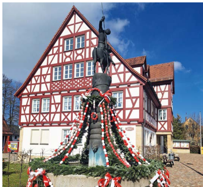
Gelebtes Brauchtum: der Osterbrunnen des Musik- und Trachtenvereins

In einer Zeit, in der sauberes Trinkwasser ein kostbares und knappes Gut war - das galt besonders in den Karstgebieten der Fränkischen Schweiz - entstand wohl dieser Brauch, die Brunnen zu schmücken. Sie wurden vorher von Unrat, Schmutz und Blättern des Herbstes und des Winters gereinigt. Als deutlich erkennbares Zeichen, dass bei einem Brunnen die Frühjahrsreinigung erfolgt war, wurde er mit frischem Grün geschmückt. Später kamen die Eier als Symbol der Fruchtbarkeit hinzu.