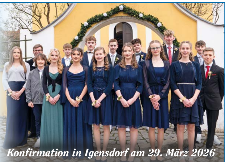
Konfirmation in Igensdorf am 29. März 2026