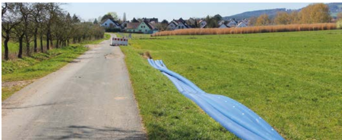
Die Rohre für die neue Leitung liegen bereits am Weg.

Am 07. April erfolgte in Mittlerrüsselbach der erste Spatenstich zum Bau der neuen Wasserleitung. Im Zuge des Förderprogramms „Kernwegenetz“ soll der Weg zwischen dem Sportplatz Mittlerrüsselbach und Unterrüsselbach saniert werden. Die alte Wasserleitung, die bis zum Anwesen Gemmel führt, ist sanierungsbedürftig, verläuft jedoch größtenteils durch privaten Grund. Daher wird die Wasserleitung entlang des Weges im Spülbohrverfahren in öffentlichen Grund verlegt, bevor der Weg saniert wird. Mit dem Bau der Leitung fällt gleichzeitig der Startschuss für ein weitaus größeres Sanierungsprojekt. Der Markt Igensdorf wird insgesamt 8 Wasserleitungen mit einer Gesamtlänge von 4.010 Metern austauschen. Die Baukosten für alle 8 Leitungen in Höhe von ca. 3,7 Millionen Euro sind im Rahmen der Förderrichtlinie RZ WAS 2021 förderfähig. Erwartet wird eine Förderung in Höhe von ca. 1,3 Millionen Euro. Im ersten Bauabschnitt werden zunächst drei Leitungen erneuert: neben der